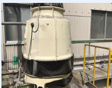
福岡県／製造係長様 クーリングタワー 50冷却トン5基

電気炉の冷却水配管が詰まって水が流れなくなり、すぐに来てもらい配管洗浄をお願いしました。洗浄後、流れは良くなったのですが、またいつ詰まるか心配で。水質管理を1炉だけお願いして現場の管理者に聞くと、「水の流れはいいですよ。それ以外なにも…」 何もトラブルがないのが一番 、他の設備もお願いしました。しっかりと管理してもらえるので助かっています。これからもお願いします。