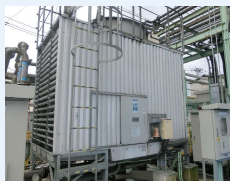
福岡県／工場長様 クーリングタワー 80冷却トン1基、その他3基

クーリングタワーの上に藻が生えて水が溢れ、頻りに清掃をしていました。 運転中はファンが回転していて危険 で、しかも高所作業です。社内の安全管理上問題でした。はじめ水質管理の説明を聞いても水のことは、さっぱりで「本当に改善するのか？」半信半疑でしたが、導入後は、藻も詰まらず危険作業はなくなり、すごく満足しています。